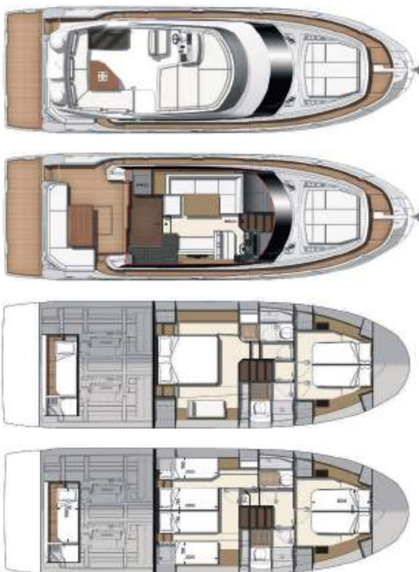
Model available with 2 or 3 staterooms

Connected boat technology. Equipped with searapps