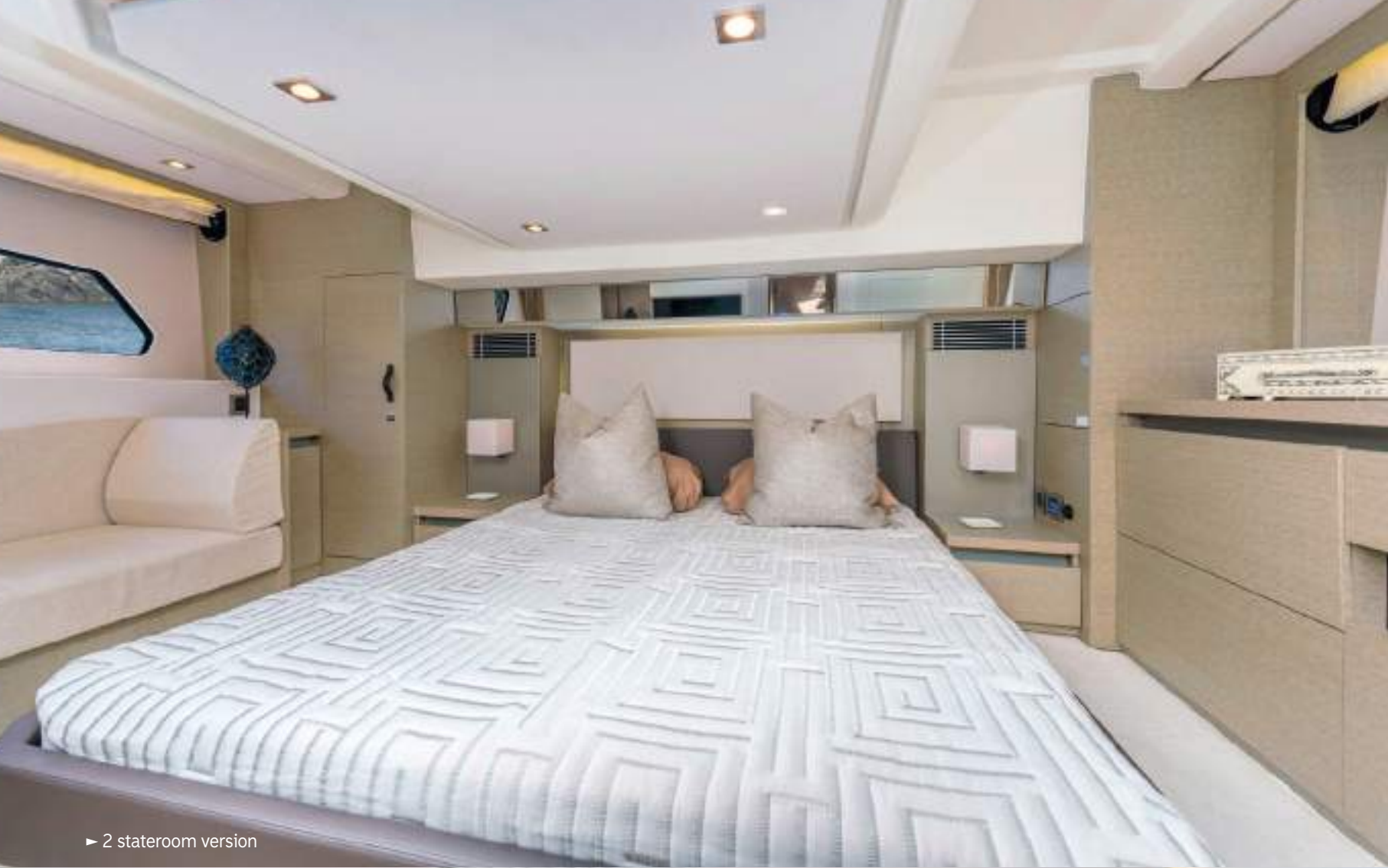
► 2 stateroom version