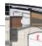
Model available with walk-in closet or bathroom